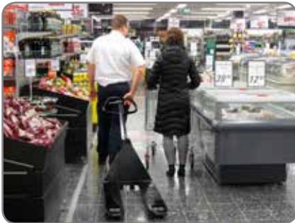
Panther Silent in einem Supermarkt, wo Komfort und Wohlbefinden der Kunden von großer Bedeutung sind.